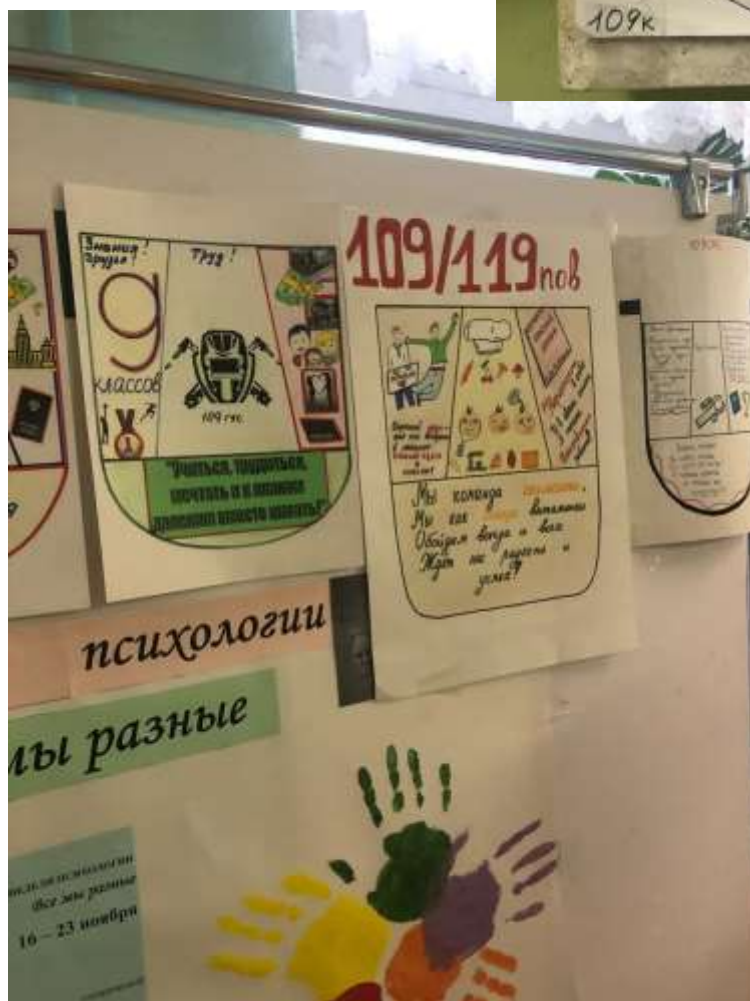
Работы студентов 1 курса индустриального отделения