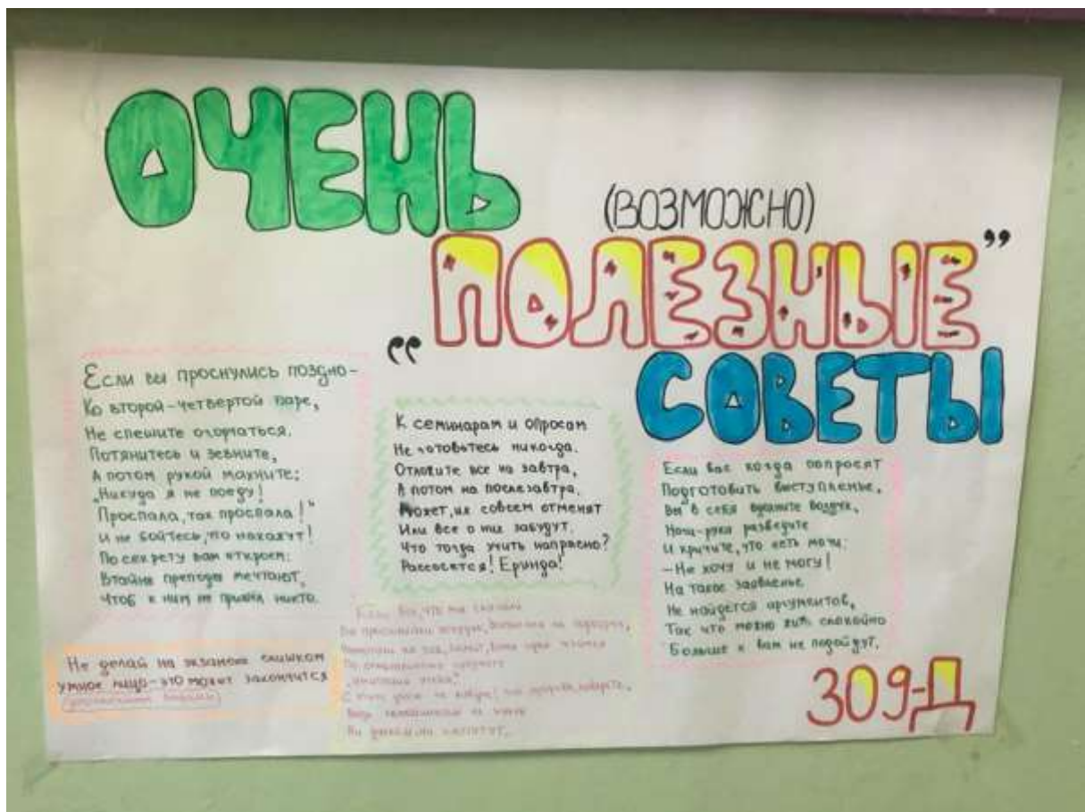
Работа студентов 3 курса (Советы первокурсникам. 309д группа)