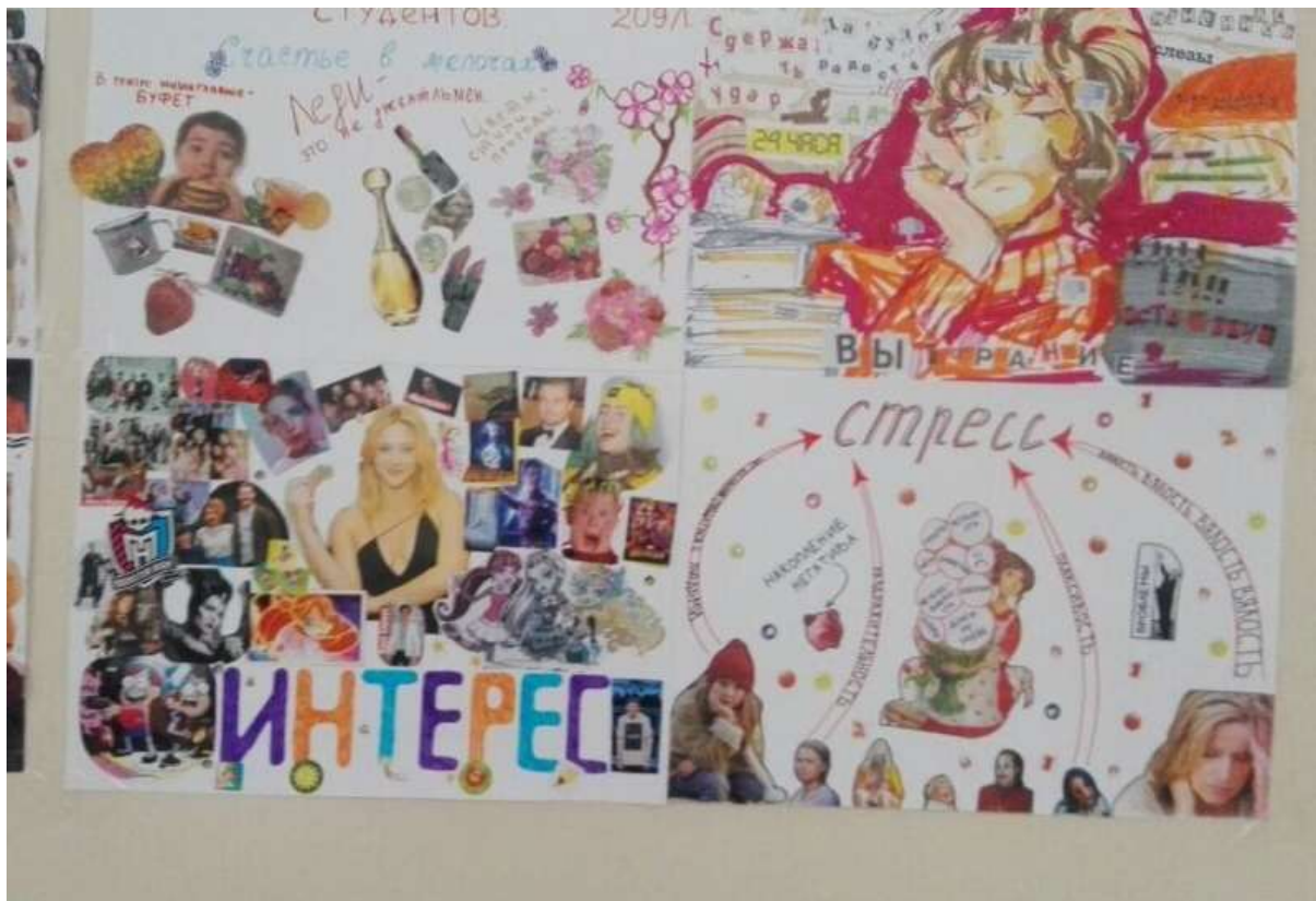
Работа студентов 2 курса (Эмоции и чувства в жизни студента. 209л группа)